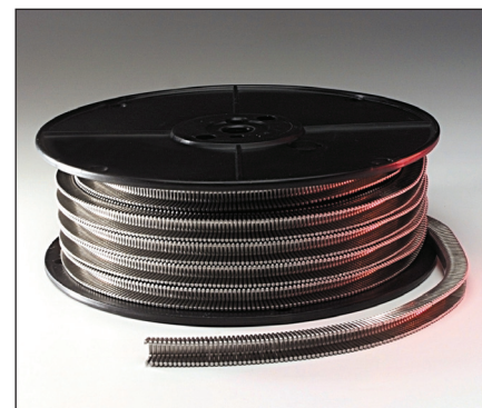
Das Gesamtpaket von einem Hersteller: Clipmaschinen, Clips und Schlaufen.

TIPPER TIE, Inc. 2000 Lufkin Road Apex, NC 27539 Tel. +1 919 362 8811 Fax +1 919 362 4839 infoUS@tippertie.com