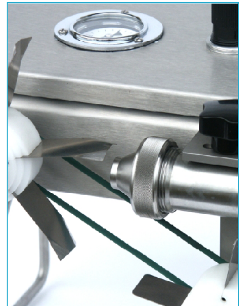
Robust- rostfrei - hygienisch