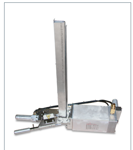
Modell F625LM für die Linkshandbedienung